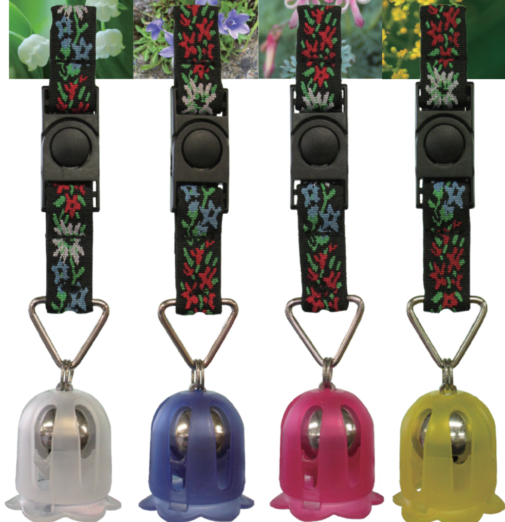
スズラン(クリアー)