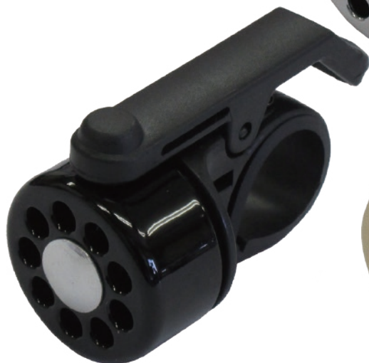
ブラック (アルミニウム)