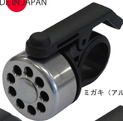
ミガキ (アルミニウム)